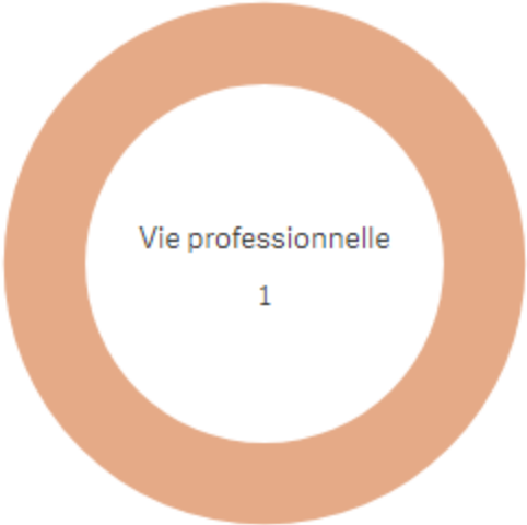
Répartition Typologie en Volume